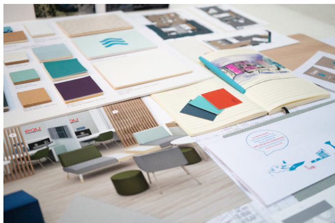
Charte d'aménagement des espaces d'accueil Veolia Eau - 2020 ©Nacarat Color Design - MönA

Nacarat a également expérimenté le potentiel de la couleur dans milieu hospitalier en 2018 aux côtés du GHU Paris Psychiatrie & Neurosciences. Ce projet pilote de repérage par la couleur traite les accueils, circulations et espaces d'attente ainsi que la signalétique des Centres médico-psychologiques Eugène Millon, Paris 15e.