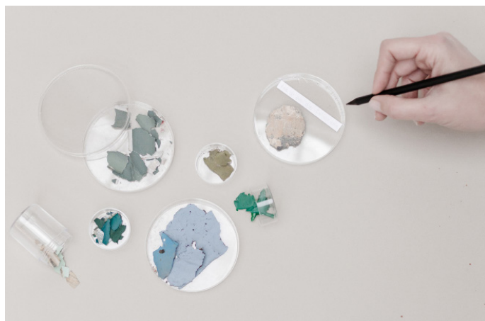
Archéologie chromatique - Ville de Toulouse - 2019 ©Nacarat Color Design - MönA

Née en 2005 des convictions et de la passion de 4 femmes, Nacarat a aujourd'hui 15 ans et fédère autour d'elle près de 150 clients, depuis les collectivités territoriales en passant par les industriels, les grands comptes ou encore les PME (Ville de Toulouse, Veolia Eau, la RATP, groupe Akzo Nobel,...).