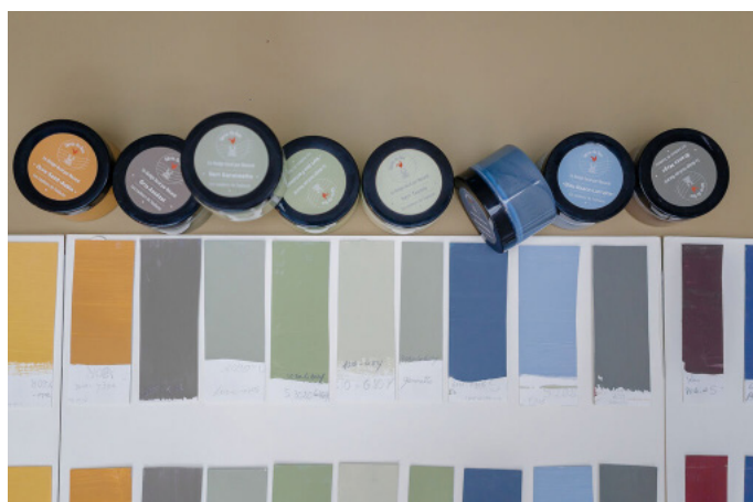
Détail du nuancier de peintures deco d'intérieur "Les couleurs de Toulouse"

Forte de son expérience et parce que la créativité est dans son ADN, Nacarat a créé sa marque Génie du Lieu. Le tout premier né est son nuancier "Les couleurs de Toulouse".