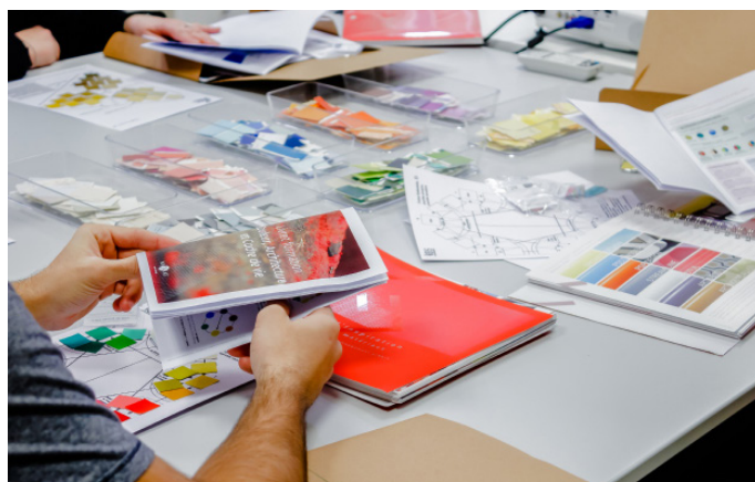
Formation Couleur - 2020